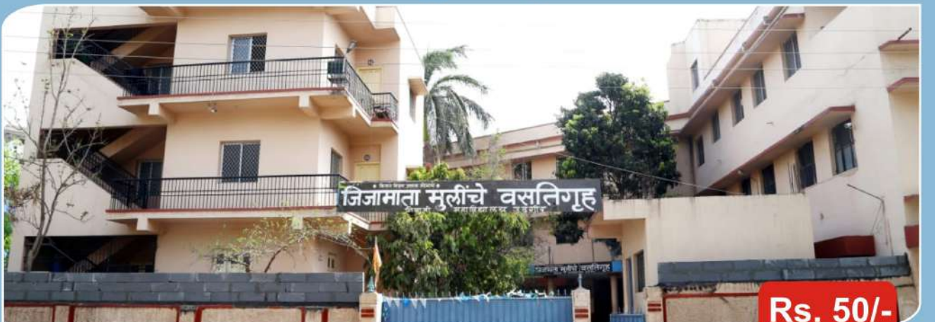
जिजामाता मुलींचे वसतिगृह