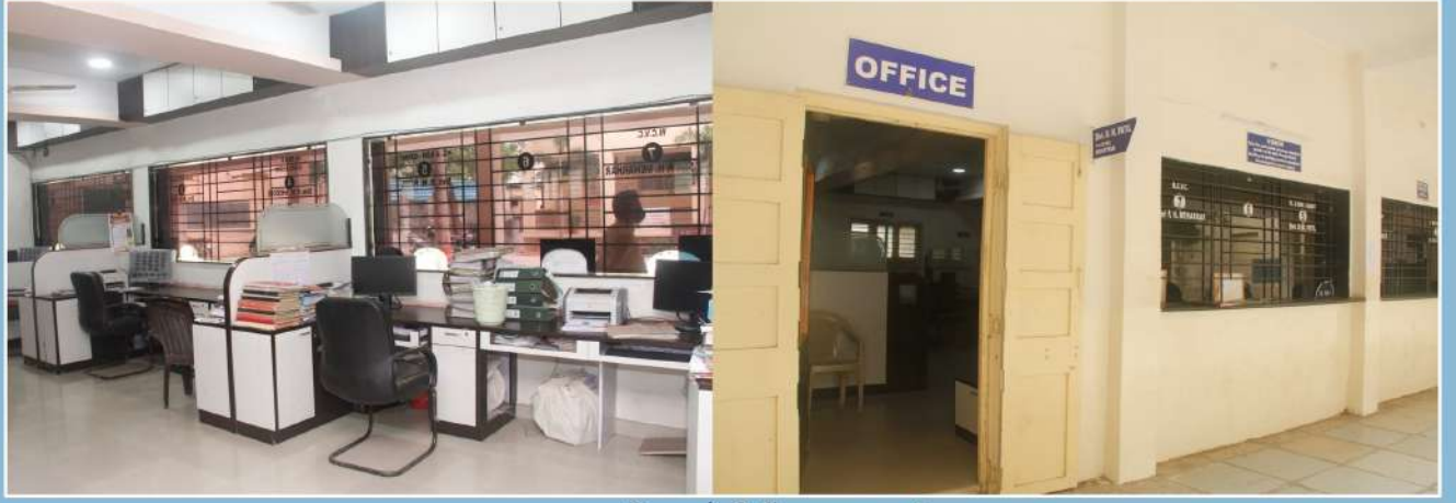
अत्याधुनिक सोयीनी युक्त कार्यालय